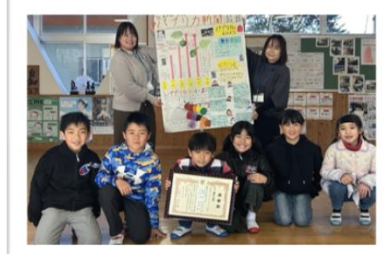
鞍岡小 3年 「えいよう、たーっぷり パブリカ新聞」