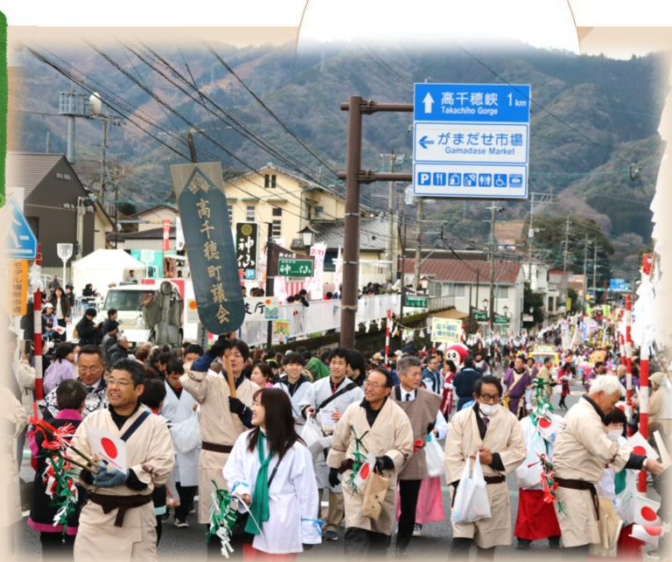
にぎわう高千穂のまち

2月11日、第41回建国まつりが開催されました。あいにくの空模様でしたが、八百万の神々に扮した地元住民が高千穂神社からくしふる神社までを堂々と行進。町は多くの観光客で賑わいました。メイン会場のSITE MITAIでは、バザーや「まが玉入れ大会」が行われ、寒さを吹き飛ばす熱戦が繰り広げられました。