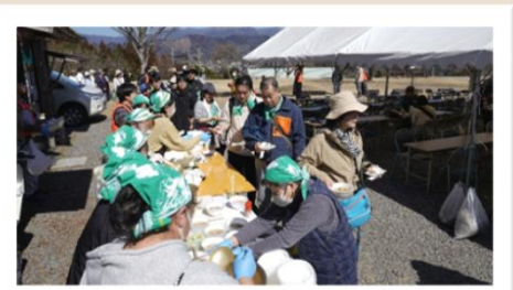
仲山城跡キャンプ場でのふるまいの様子

各中継地点では、地元の方々による温かいだご汁やお菓子などの「ふるまい」が行われたほか、ゴール後には豪華景品が当たる「抽選会」も実施されました。地域のおもてなしに包まれ、会場は大盛り上がりとなりました。