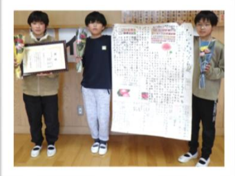
高千穂小 5年 「高千穂のランタンキュラス」