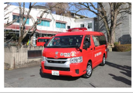
山火事防止パレードへ出発！