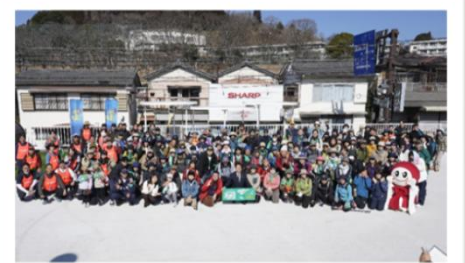
参加者全員で集合写真