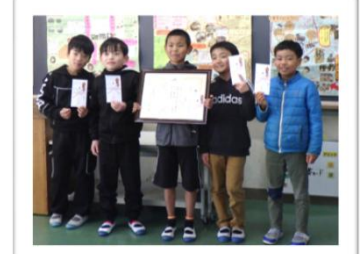
宮水小 3年 「日のかげモーモー新聞」