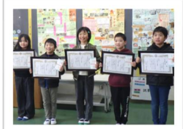
宮水小 3年 「日之影びっ栗新聞」