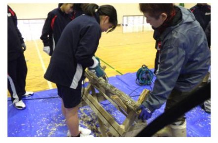
駒打ち体験の様子

今回植菌した椎茸は来秋に収穫・加工し、修学旅行先で生徒自ら販売する予定です。西臼杵支庁では、こうした森林環境教育を推進しています。ご関心のある方は、ぜひ林務課までお問い合わせください。