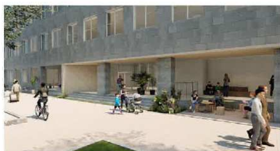
高千穂通りから見た北棟入口イメージ

1階は、ワーカーや来訪者の皆様の日常に彩りを添える上質な商業空間を計画しており、最大6店舗計画しています。