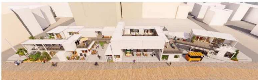
南棟外観イメージ