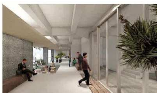
北棟オフィスエントランスイメージ