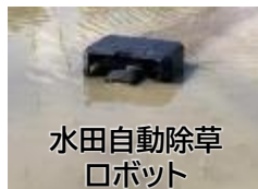
水田自動除草ロボット