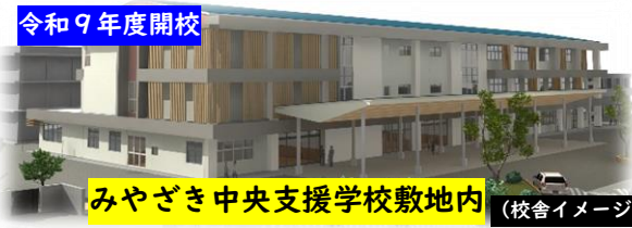
みやざき中央支援学校敷地内