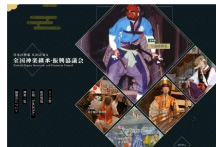
全国神楽継承・振興協議会HP