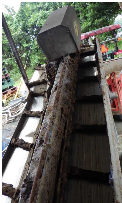
バークリーナー(東側)