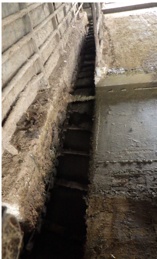
バークリーナー(牛舎側)