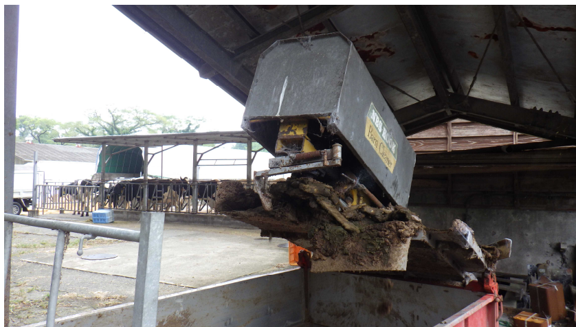
バークリーナー(東側)