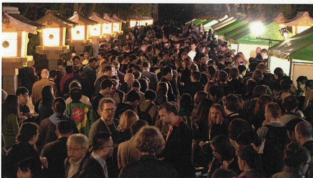
LREC 2018 MIYAZAKI ウェルカムパーティ：宮崎神宮