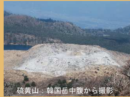
硫黄山：韓国岳中腹から撮影