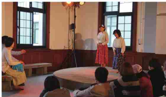
みやざき◎まあるい劇場「素敵な日曜日」 (2021.4 県庁5号館)