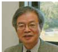
伊藤一彦 審査委員長

1943年宮崎県出身。若山牧水記念文学館館長。歌人。歌集に『海号の歌』(読売文学賞)、『新月の蜜』(寺山修司短歌賞)、『微笑の空』(遼空賞)、『月の夜声』(斎藤茂吉短歌文学賞)、『土と人と星』(現代短歌大賞・毎日芸術賞)、『遠音よし遠見よし』(詩歌文学館賞)、『最新エッセイ集『歌が照らす』』、編著に『若山牧水歌集』(岩波文庫)、『俳優の堺雅人との対談集『ぼく、牧水!』』他。