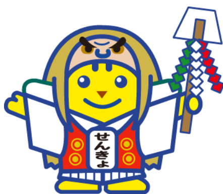
神楽めいすいくん