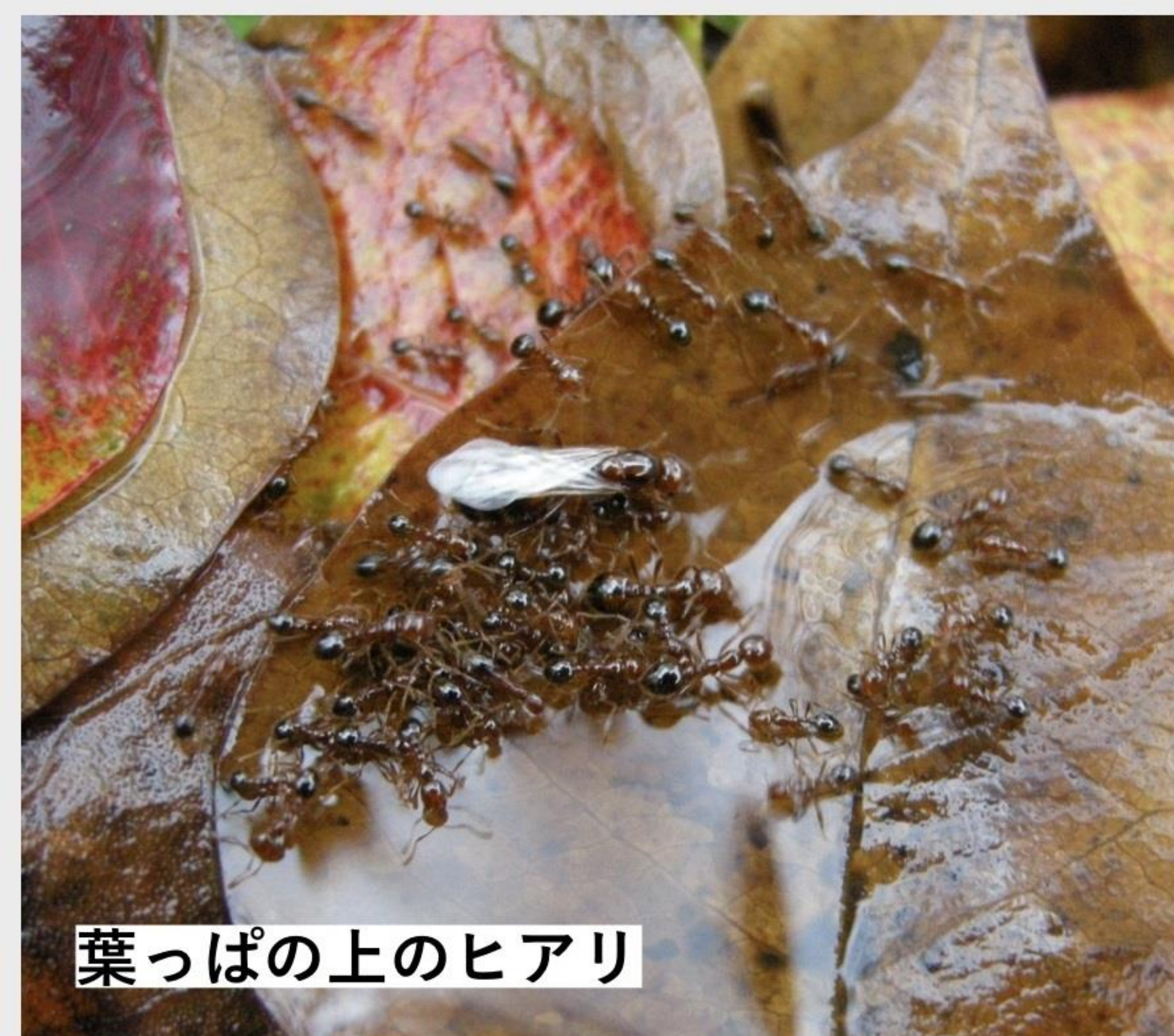
葉っぱの上のヒアリ