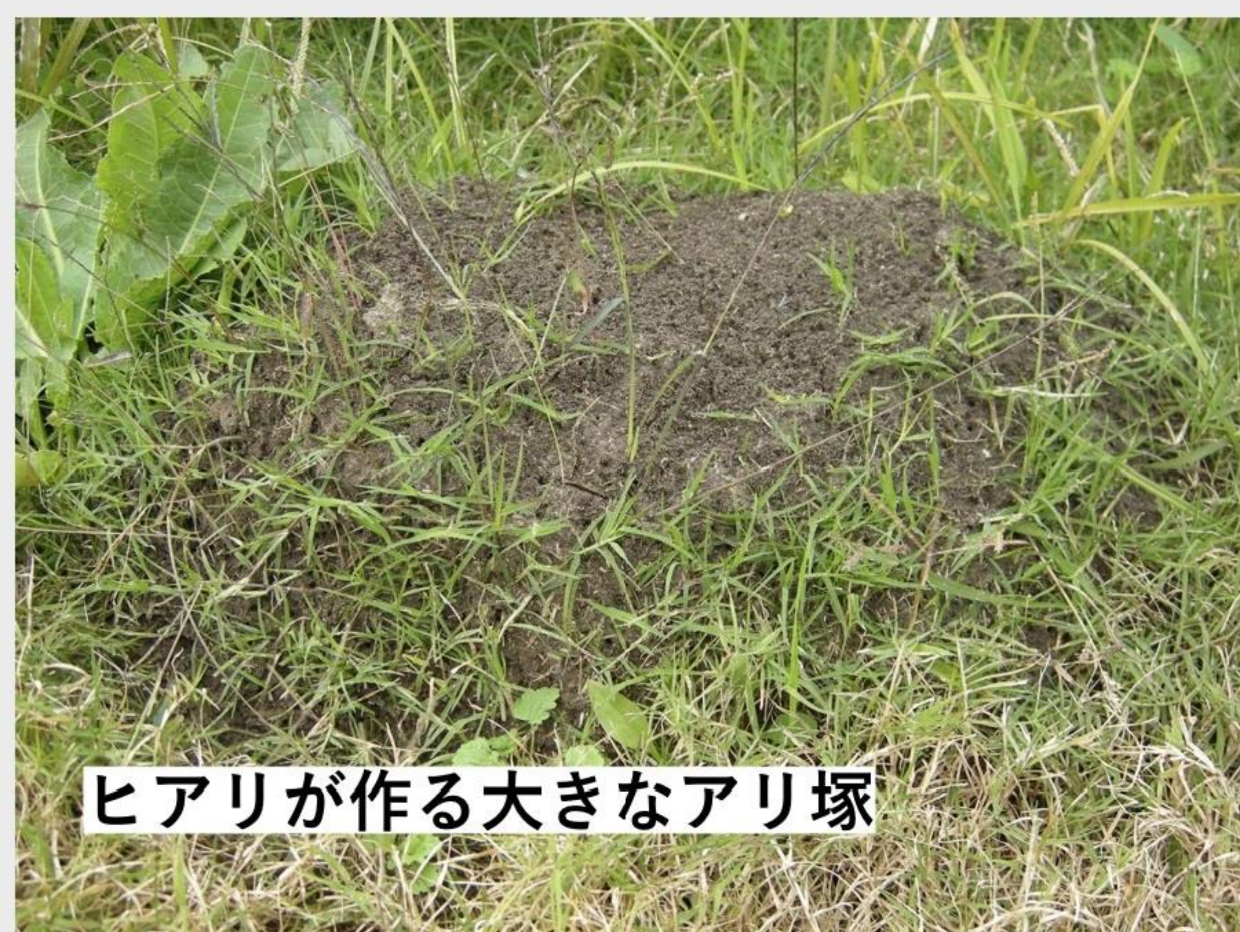
ヒアリが作る大きなアリ塚

これまで存在していなかった危険な毒アリが国内で現れています。 もし発見しても、 決して触らないでください！