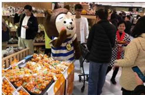
SOGO「宮崎きんかんフェア」

宮崎で大人気のイベント「きんかんヌーボー」を海外で初めて開催しました！告知をしてすぐに定員オーバーとなる盛況ぶり、香港メディアからも、これまでにない面白いイベントだと多くの問い合わせをいただきました。