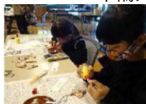
端材を使った作品作り