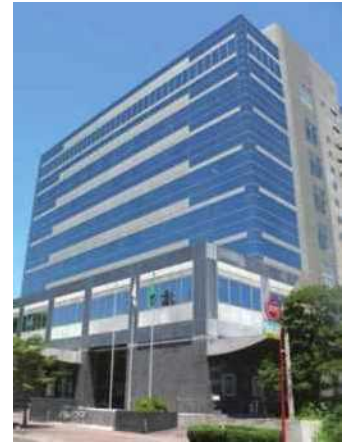
宮崎県企業局庁舎

一般の行政機関の財源が税金であるのに対し、地方公営企業の財源は、それぞれの事業で得られた料金収入となっており、経営に当たっては、独立採算制の下で、常に企業としての経済性を発揮することが求められています。