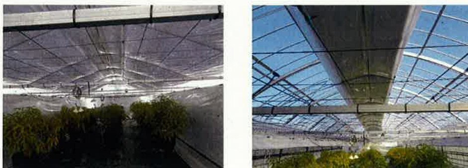
図2 アルミ蒸着シート 全閉時(左)、全開時(右)