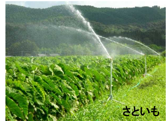
工事が完成すると農地に散水できます