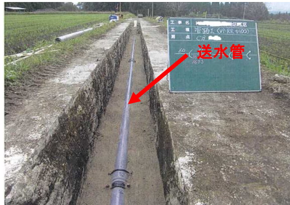
道路の中に埋設しています。