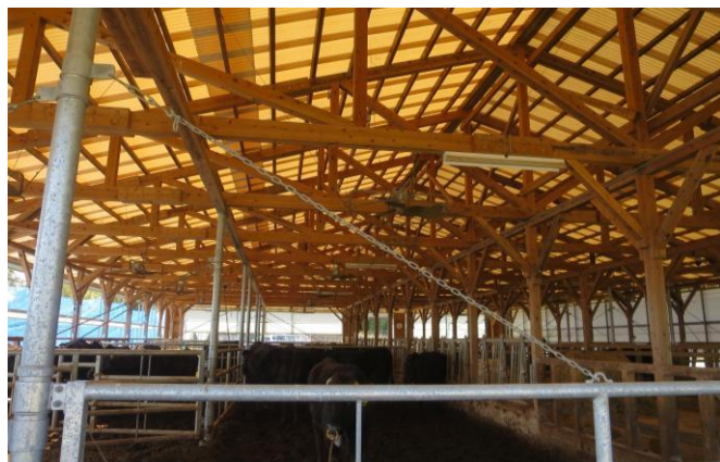
2-(4) モデル畜舎の作成(牛舎見学)