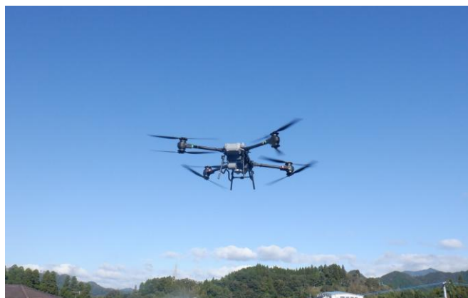
1-(2) 軽労化への支援(苗木運搬ドローン)