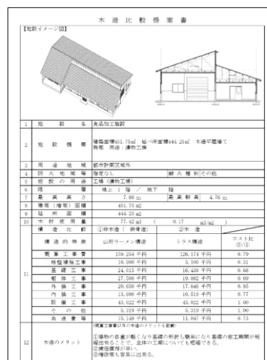
2-(4) 木造比較提案資料