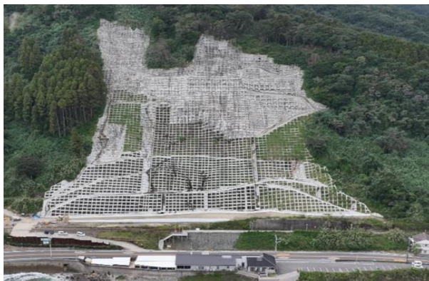
3-(2) 令和3年度災害関連緊急治山事業及び令和4年度緊急総合治山事業 磯平地区(宮崎市)