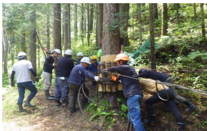
2-(1) みやざき林業大学校短期課程(林業作業士養成研修)