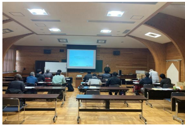
1-(4) 地域林政アドバイザー研修会の開催