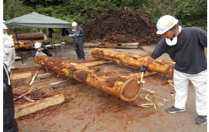
5-(1) 県産材の強度性能の明確化