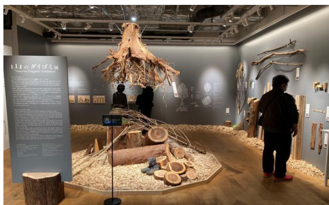
2-(2) 山のダイゴミプロジェクト展示