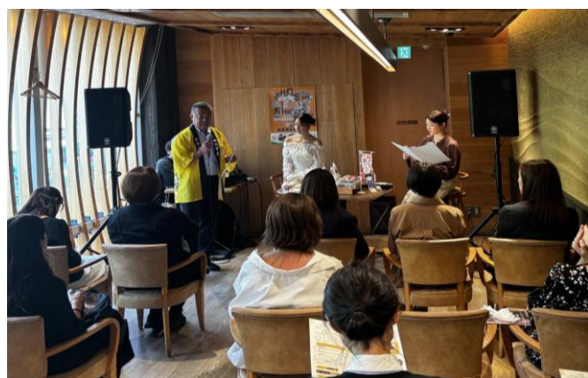
4-(2) 販売促進イベント(新宿みやざき館KONNE)