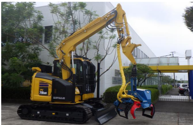
1-(4) 高性能林業機械等の導入(ハーベスタ)