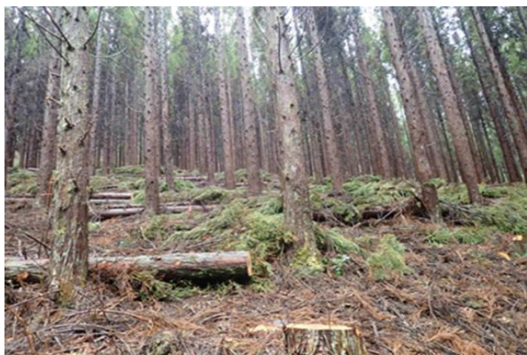
3-(1) 令和6年度保安林整備事業 小原地区