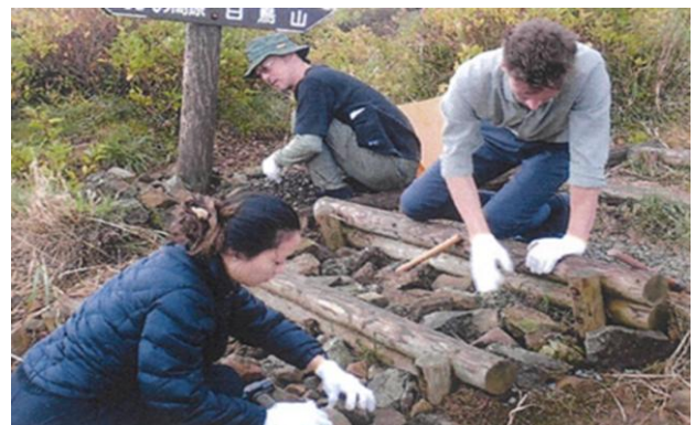
1-(4) 登山道整備体験(霧島錦江湾国立公園)