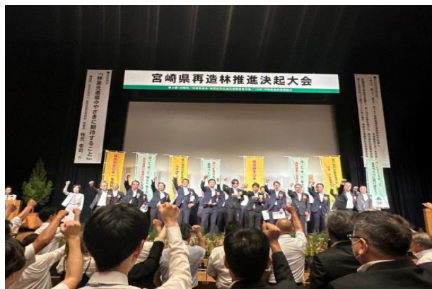
2-(1) 再造林推進決起大会の開催