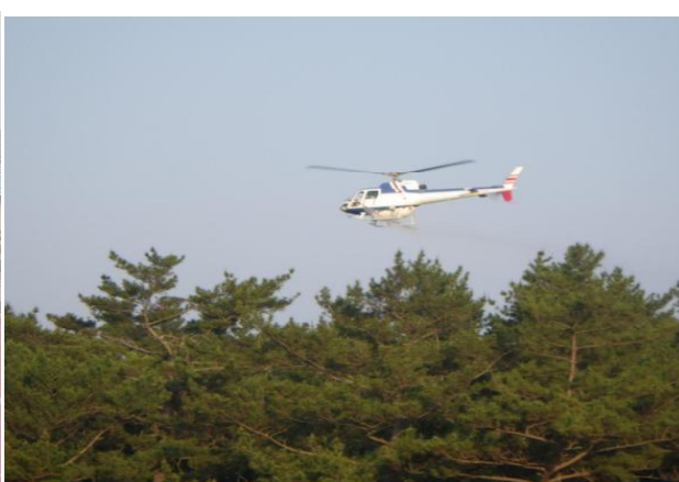
3-(5) 令和6年度松くい虫薬剤防除事業(特別防除:宮崎市)