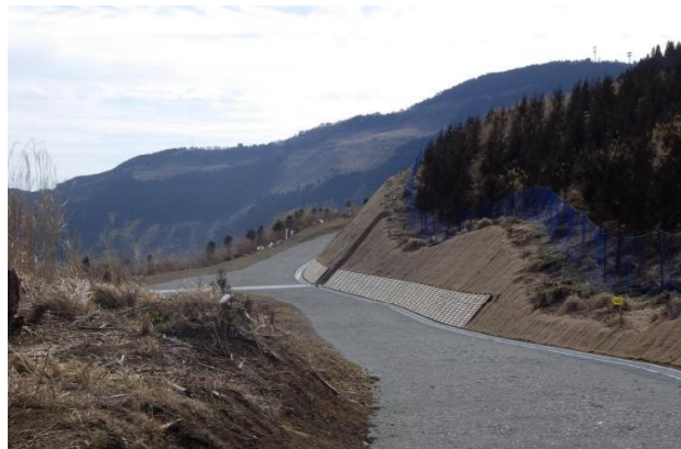
2-(4) 林道開設事業 山神・持田線