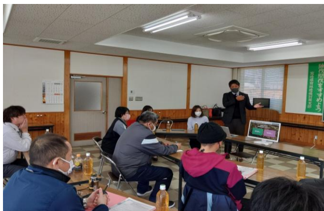
1-(3) 原木流通情報デジタル化(実証試験現地説明会)