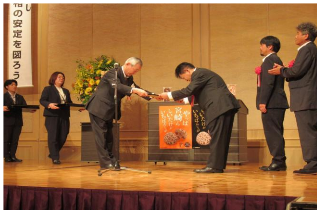
4-(1) しいたけ品評会表彰式