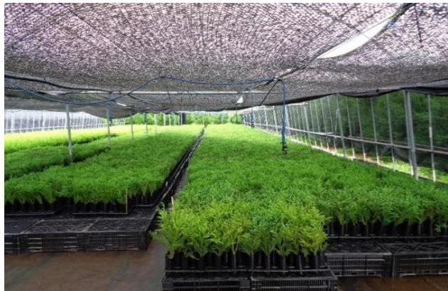
2-(3) 試験的生産への支援(穂木の挿し付け)