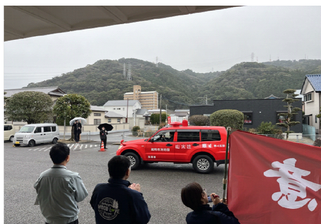
3-(4) 林野火災予防パレード