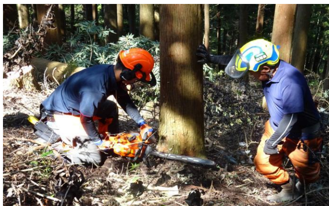
2-(1) みやざき林業大学校長期課程(伐倒研修)