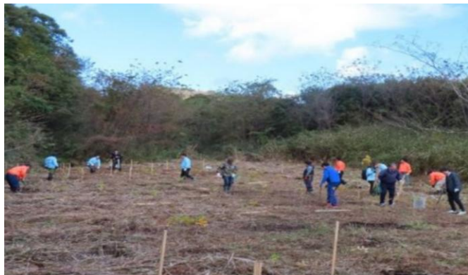
3-(1) 森林ボランティア団体による森林づくり活動