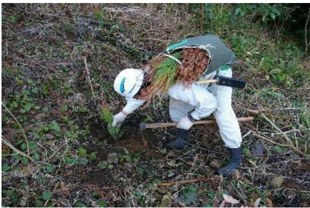
1-(3)(5) 再造林(スギ苗木の植栽)