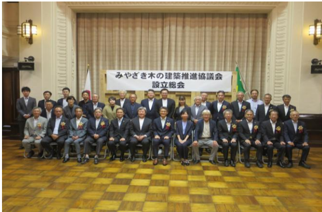
5-(2) みやざき木の建築推進協議会