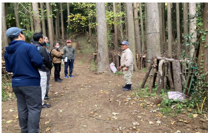
4-(1) 原木しいたけ生産研修