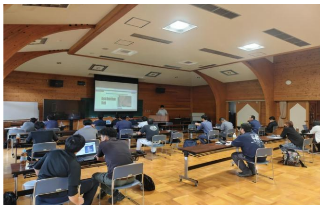
1-(4) クラウド型ドローン測量ツール操作研修会