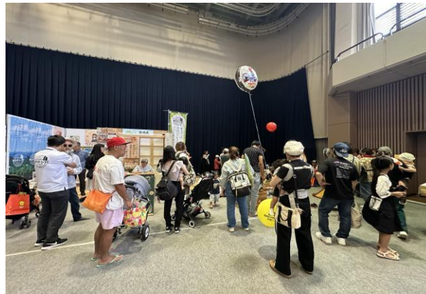
3-(2) 県産材の家づくりPRブース出展