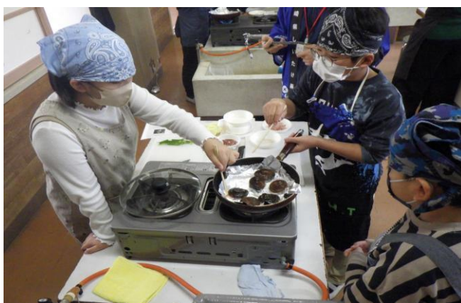
4-(2) 小学校での食育講座