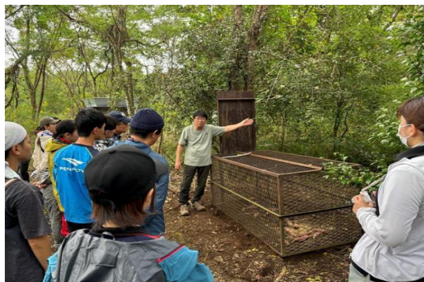
2-(5) わな捕獲技術向上研修会