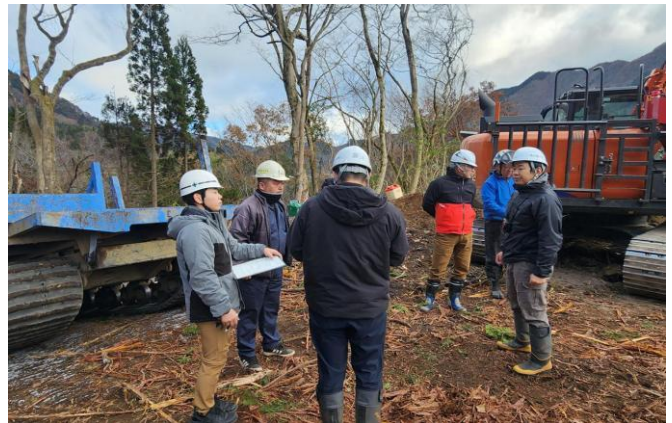
5-(3) 林業事業者への伐採指導