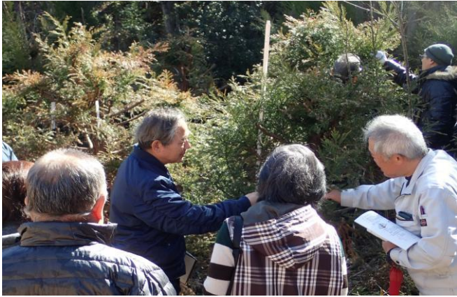
5-(1) スギ採穂母樹の管理と苗木生産技術の移転