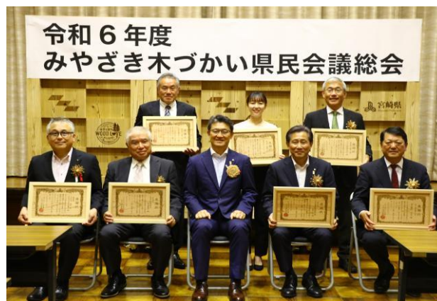
3-(5) みやざき木づくり県民会議の開催