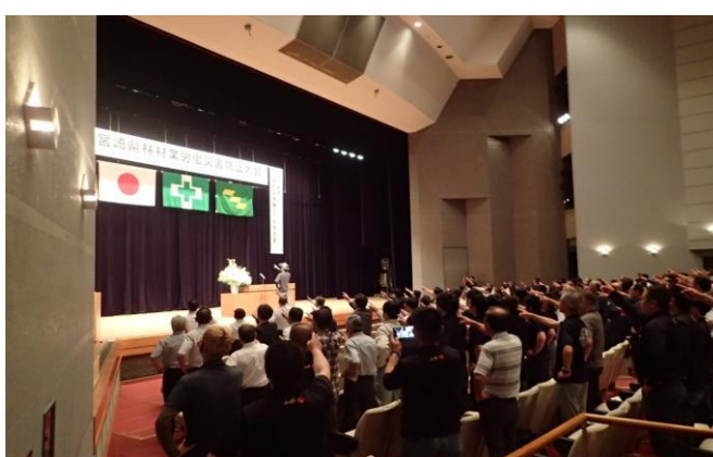
2-(4) 労働災害防止大会(指差呼称)