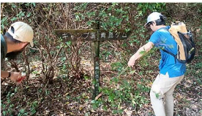
1-(3) 九州自然歩道維持管理(川南町)