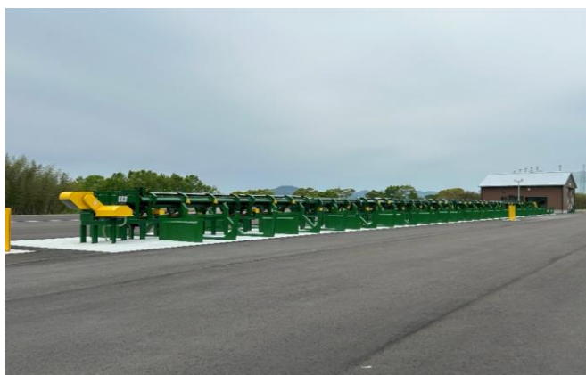
2-(2) 木材加工流通施設の整備(原木選別機)