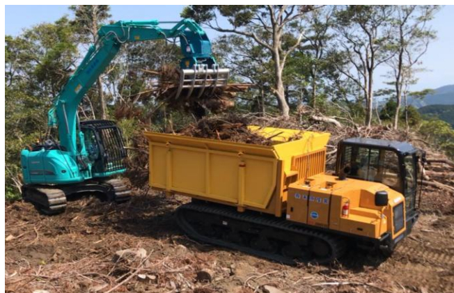
2-(3) 短尺材・枝条等の収集運搬