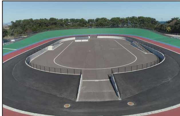
② インフィールド（新設）