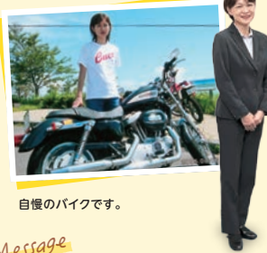
自慢のバイクです。