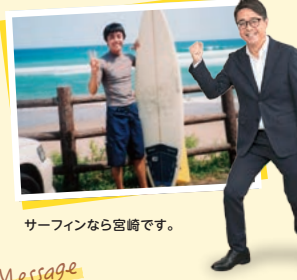
サーフィンなら宮崎です。