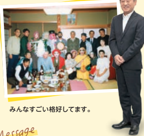
みんなすごい格好してます。