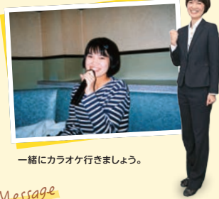
一緒にカラオケ行きましょう。