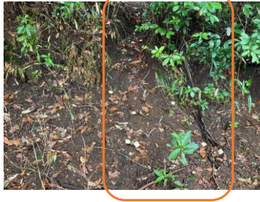
ワクチン散布後の状態（獣道に沿った散布）