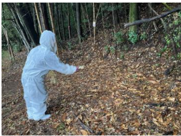
ワクチン運搬・散布係がワクチンを散布 記録係は、散布回数（毎回）、GPS（緯度、経度）、 写真を記録