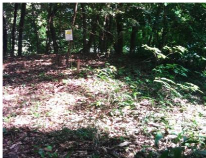
撮影写真イメージ