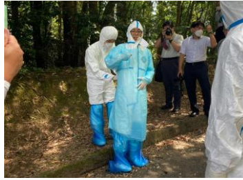
タイベックフルセット（エプロン、ブーツカバーも着用） ※県内で豚熱が蔓延している場合には、このスタイルで作業