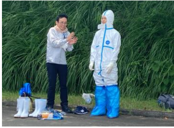
作業時はタイベック着用