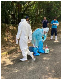
散布後、乗車前にブーツカバー、手袋を脱ぎ、ゴミ袋に廃棄。 長靴の裏を中心に消毒し、汚れている場合は、洗い流す 次の散布地点へ向かう