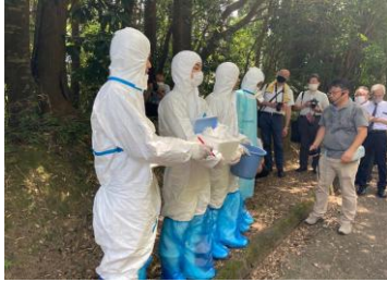
作業は2人体制で行う （①指示・記録係、②ワクチン運搬・散布係）