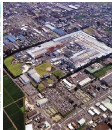
住友ゴム宮崎工場全景