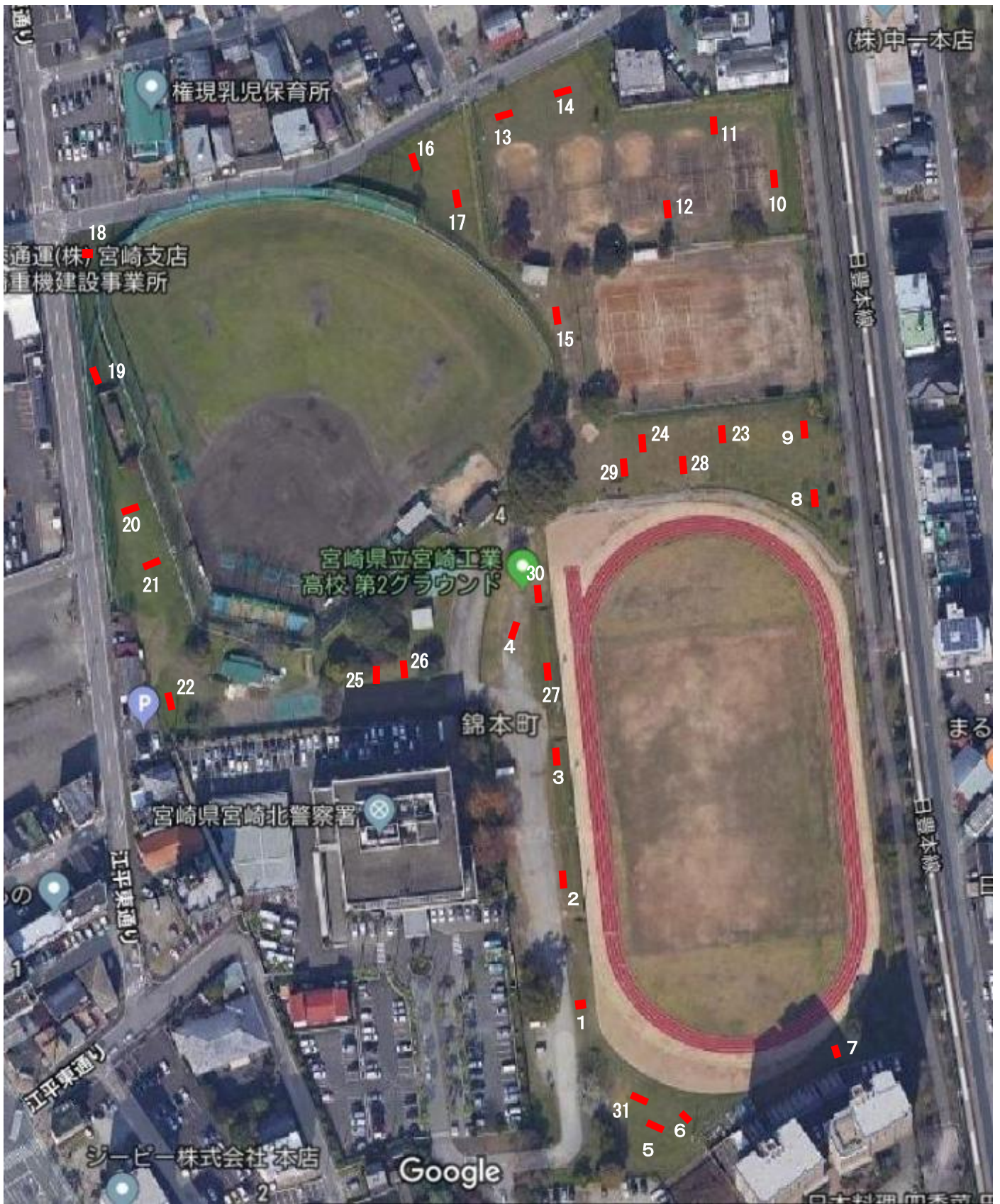
第2図 トレンチ1~31 配置図