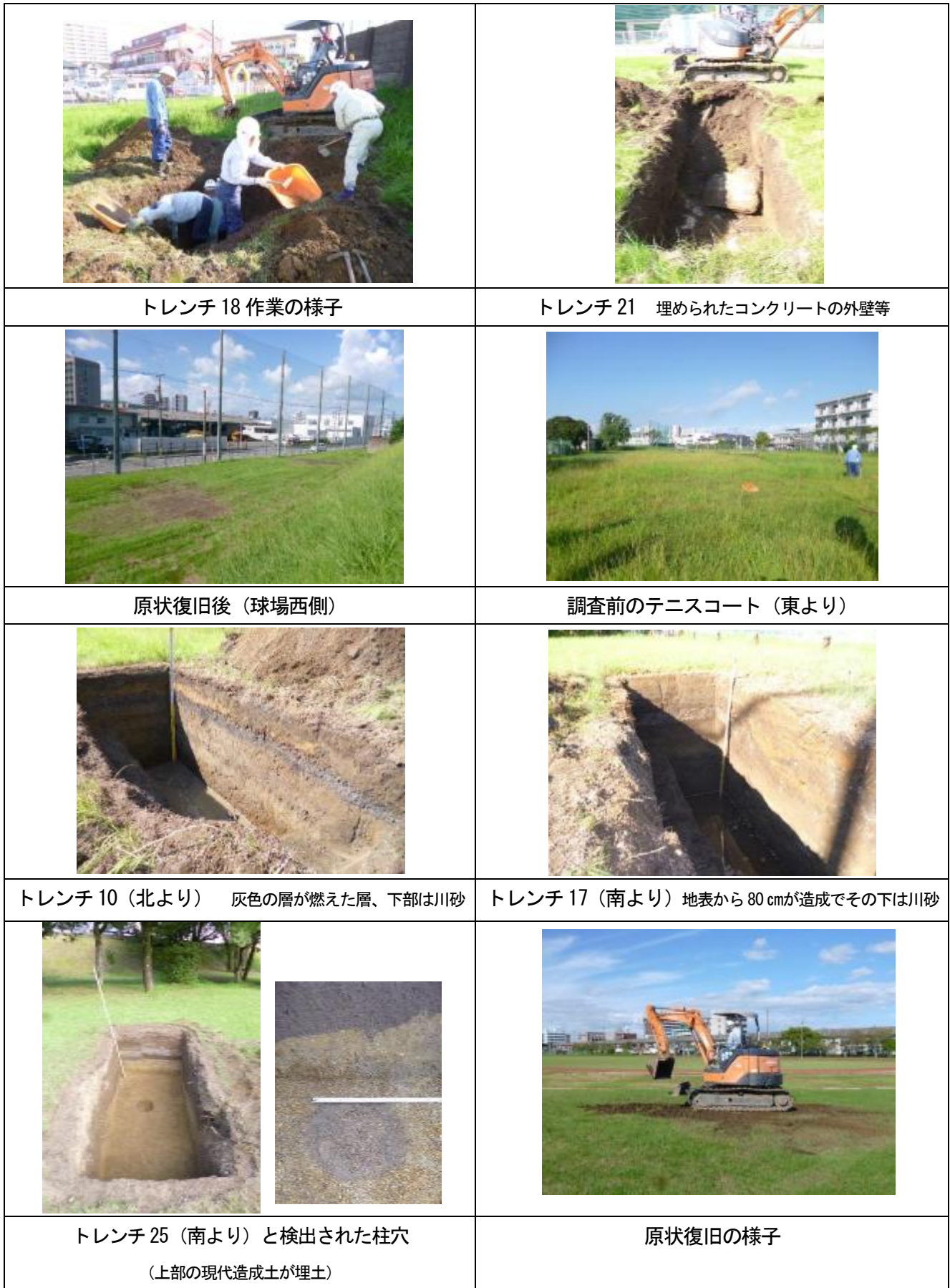
第 5 図 調査状況写真（2）