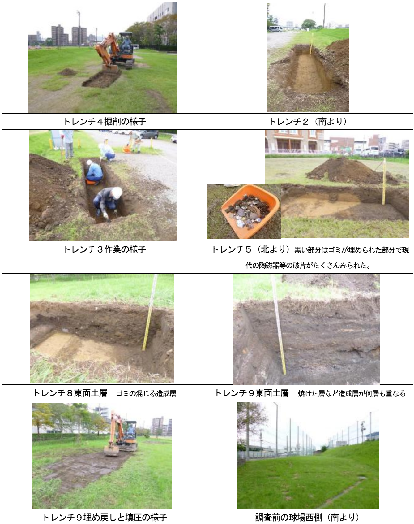
第 4 図 調査状況写真 (1)