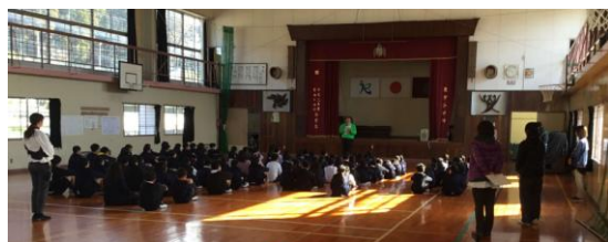
(写真:小学校での講習の様子)

不審者かどうかの判断は難しいですが、全職員が挨拶等の声かけを常に心がけて行っていくことの大切さや、道具を使うなどして不審者がいることを伝える方法を考える必要があることを学びました。 (小学校教諭)