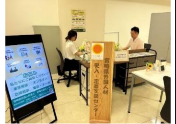
【外国人材受入・定着支援センター】