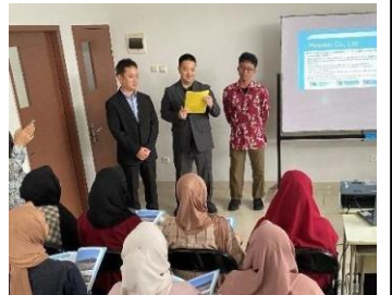
【海外の送出機関でのPR】