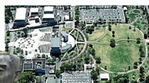
総合文化公園の整備 (置県100年記念事業)

置県150年に向けたプロジェクト創出・推進のための県民会議の設置、機運醸成のためのシンポジウム開催、取組の具体化に向けた企画・調査の実施