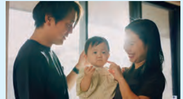
ひなたの「とも活」で男女とも活躍できる宮崎へ！