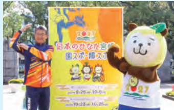
国スポ・障スポを盛り上げましょう！

特ジャパンの宮崎キャンプには約20万人が訪れ、大きな経済効果やPR効果をもたらしました。初めてテニスの国際大会が開催されるなど、本県の強みであるスポーツには、地域に