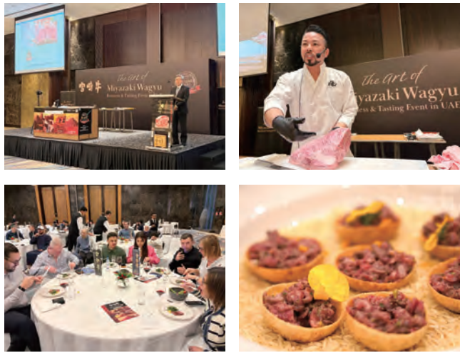
↑パニプリ風に宮崎牛をアレンジしたもの

令和8年1月に西都市の(株)SEミート宮崎*から、アラブ首長国連邦への輸出が解禁されました。 これに先立ち、ドバイで宮崎牛レセプションを開催し、宮崎牛の特長や(株)SEミート宮崎の取り組みなどを紹介した後、宮崎牛の調理方法の実演や商談会を実施しました。 当日は、同国最大の和牛バイヤーや高級レストランのシェフ、人気インフルエンサー、さらには「アラブニュース」などのメディアも多数来場！ 宮崎牛に対する注目の高さと、和牛人気のすごさを改めて肌で感じる機会となりました。 ※(株)SEミート宮崎は、県産牛肉のイスラム圏における輸出拡大に向けて、宮崎県内で初めてハラル認証を取得した食肉処理施設です！