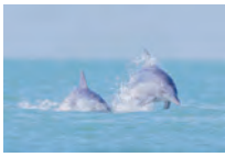
玉田尚之「季節外れのイルカ」

全国の写真家たちによる自然科学をテーマにした写真や動画、作品に登場する動物や植物などの標本を展示します。