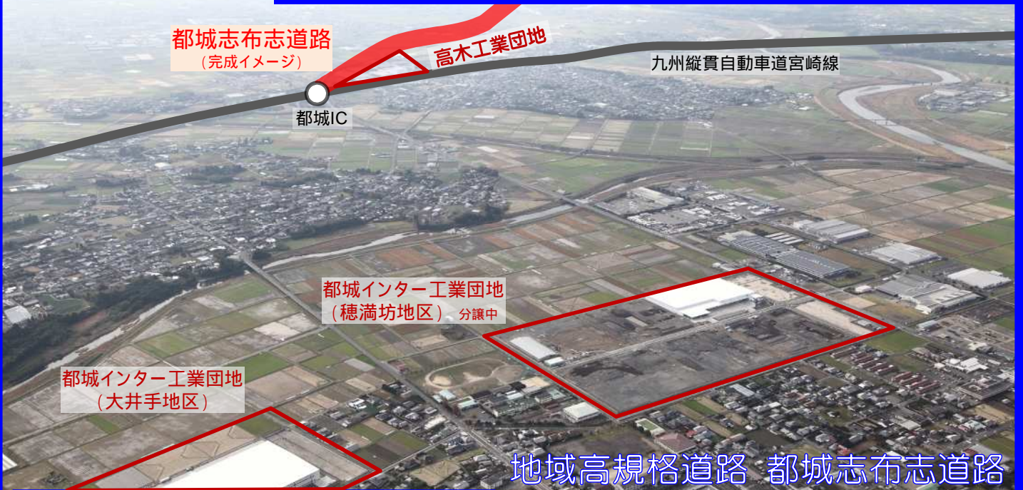
地域高規格道路 都城志布志道路