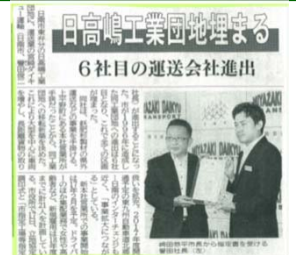
H28.8.27宮崎日日新聞より

H29.2宮崎ダイキュー運輸立地 約78,000㎡の用地完売！ 計461名の雇用創出！