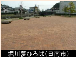
堀川夢ひろば(日南市)