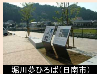
堀川夢ひろば(日南市)