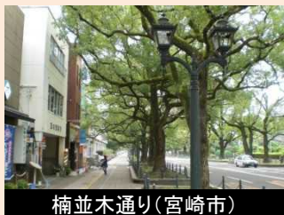
楠並木通り(宮崎市)