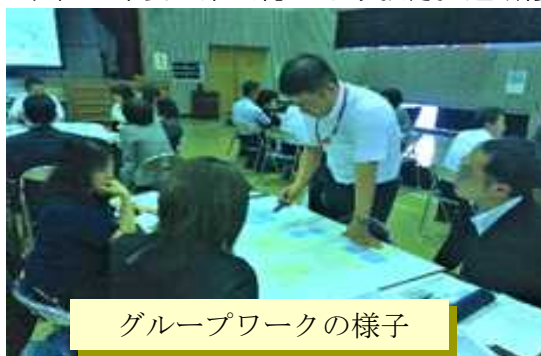
グループワークの様子

※ 令和2年度の県民総ぐるみ教育推進研修会は新型コロナウイルス感染症の影響により中止