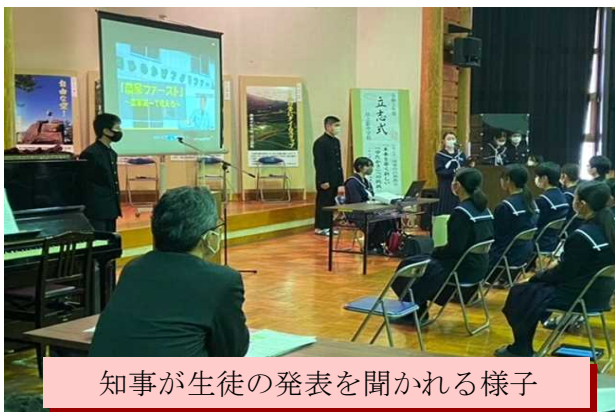
知事が生徒の発表を聞かれる様子