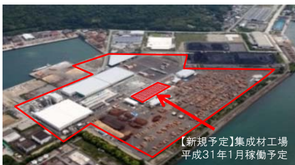
【新規予定】集成材工場 平成31年1月稼働予定