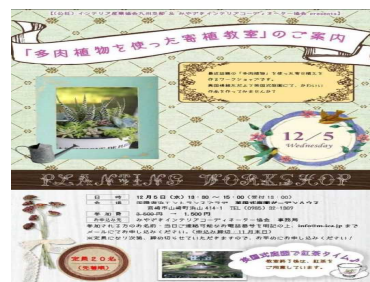
【美しい宮崎づくり活動団体が作成した資料を県が記者へ提供】