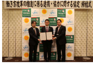
【宮崎労働局及び宮崎県社会保険労務士会との協定締結の様子】