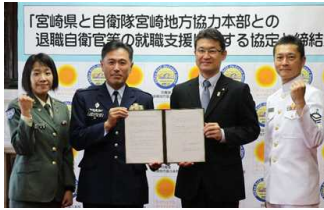
【自衛隊宮崎地方協力本部との協定締結の様子】