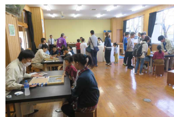
【「土木の魅力」に関する出前講座の様子】