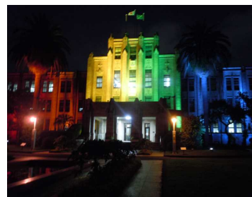
【県庁本館ライトアップの様子】

性の多様性について多くの県民に認識していただくため、人権啓発活動の一環として県庁舎のレインボーカラーでのライトアップを行う。