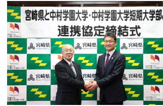
【中村学園大学等との連携協定締結の様子】