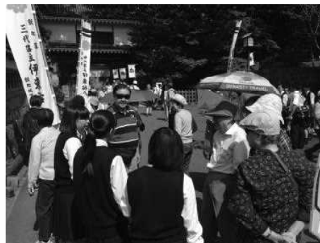
クルーズ船寄港時の様子