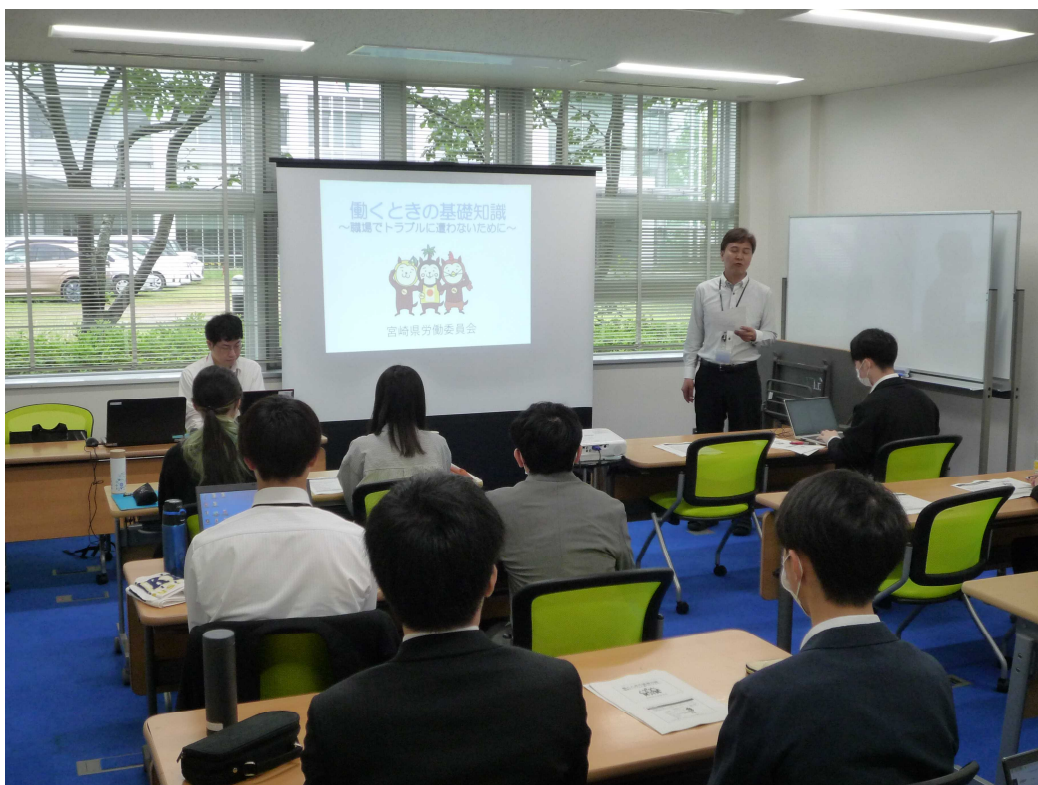
(事務局職員による講義)