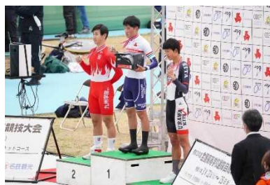
②全国高校選抜大会優勝選手