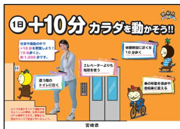
①健康づくり啓発ポスター