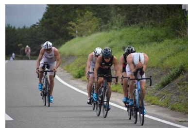
③ トライアスロン競技ノルウェー代表 東京オリンピック 2020 事前合宿