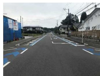
②自転車通行帯の整備（日南市道）