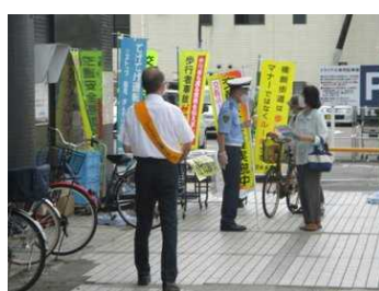
①交通安全の呼びかけ