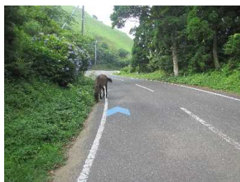
① 自転車通行空間整備 (県道都井岬線)