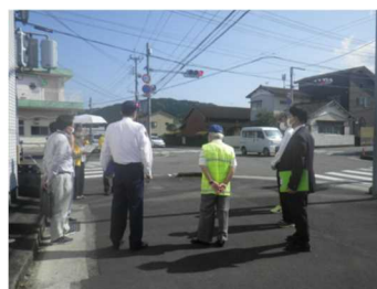
⑤通学路の安全点検