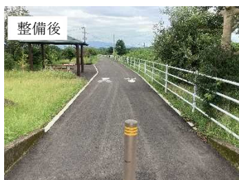
①大規模自転車道の改修（宮崎佐土原西都自転車道）