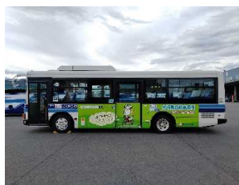
②自転車条例の啓発（ラッピングバス）