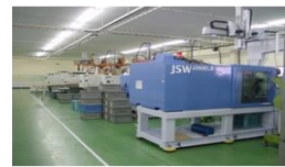
プラスチック成型