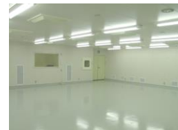
「クリーンルーム」 (クラス1000、100)