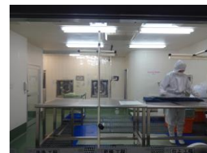
クリーンルーム外観