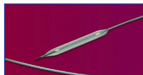
バルーンカテーテル