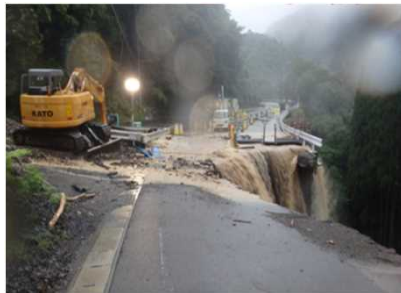
国道219号 土砂災害等による全面通行止 H27～R2: 1.1回