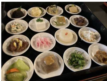
おがわ作小屋村「おがわ四季御膳」