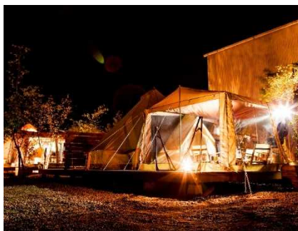
大人気のグランピング