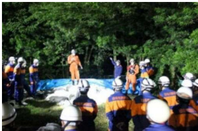
消防団との水防訓練 （日向市）