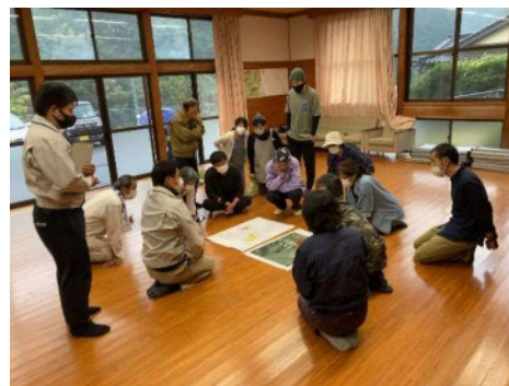
土砂災害警戒区域説明会（美郷町）