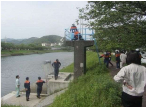
樋門点検（日向市塩見川）