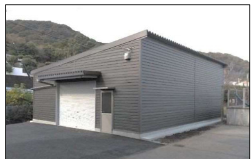
日向市防災備蓄倉庫（防災拠点施設）