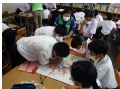
門川中学校DIG訓練（門川町）