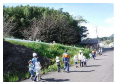
あさひ学園避難訓練（門川町）