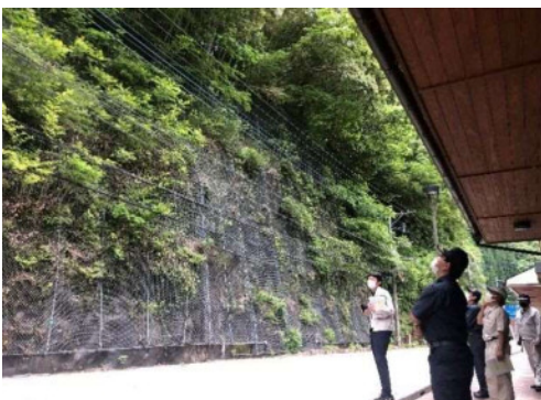
危険箇所調査（諸塚村）