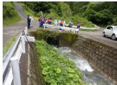
危険箇所調査（椎葉村）