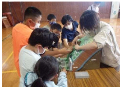
土砂災害防止教室（坪谷小学校）