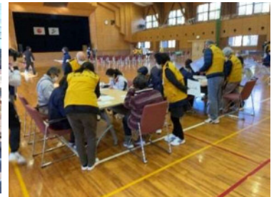
災害ボランティアセンター設置訓練 （美郷町）