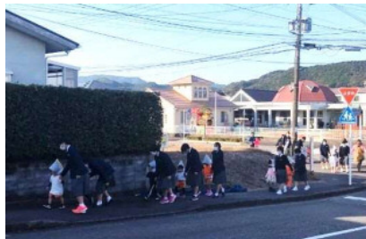
教育機関と連携した避難訓練 （日向市）