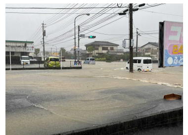
令和6年10月線状降水帯による浸水状況