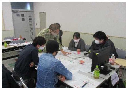
(短期課程：森林施業プランナー養成研修)