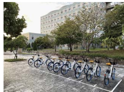
シェアサイクルのサイクルポート