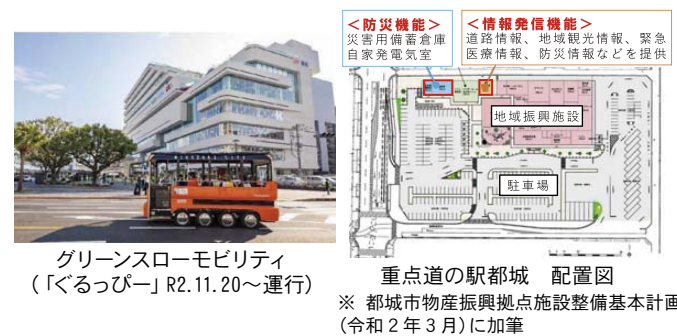
グリーンスローモビリティ（「ぐるっぴー」R2.11.20～運行） 重点道の駅都城 配置図 ※ 都市物産振興拠点施設整備基本計画（令和2年3月）に加筆