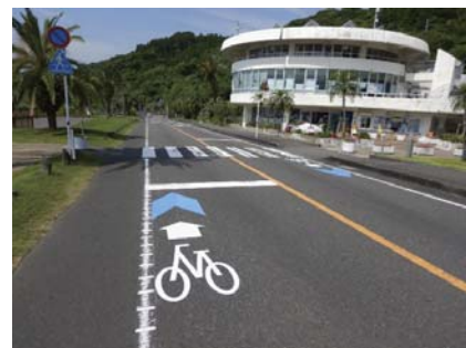
自転車通行空間の整備