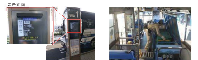
路線バス接近の案内(バスロケ)