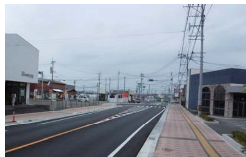
都城霧島公園線(早鈴岳下通線) 鷹尾蓑原工区