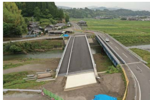
元狩倉日南線 山本工区