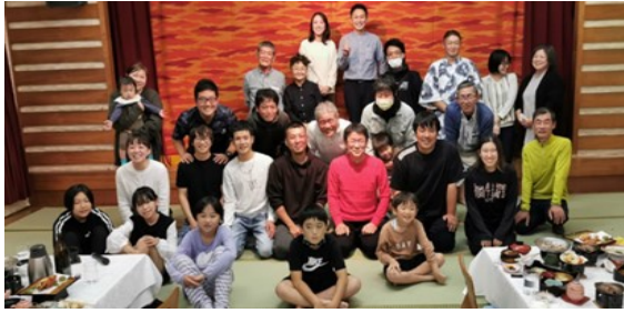
「宿泊型の新入社員歓迎・慰労・忘年会」の様子