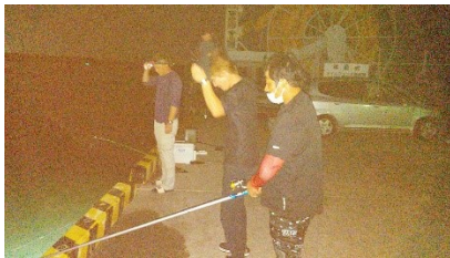
「釣りクラブ」夜釣りの様子

運動習慣の改善や社内でのコミュニケーションをとる場の不足が目立ってきたため社員の趣味をきっかけに釣り・マラソン・ゴルフクラブを設立しました。リフレッシュする機会づくりを行うことにより社内が明るくなりました。心の運動習慣改善で健康増進、体の運動習慣改善は SALKO にて予定しております。令和 4 年は県公式ウォーキングアプリ「SALKO」を会社が支給している全てのスマホにダウンロードし、活用率 50% 以上を目標に健康意識の高揚を図ります。