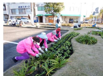
(3)③ 地域と協働した 植栽活動 (日南市)