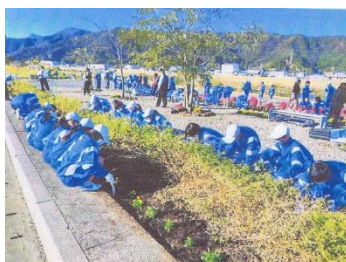
(2)② 活動団体の取組に参加する地域の 中学生(延岡市コノハナロード)