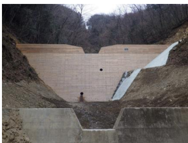
(1)③ 自然との調和に配慮したダム工事 (木製残存型枠の採用)