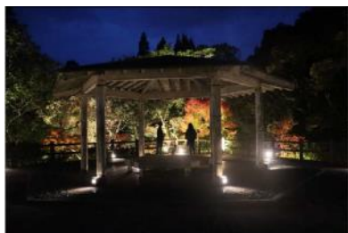
(1)① 景観の磨き上げ (三股町長田峡ライトアップ)