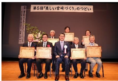
(1)② 美しい宮崎づくり 大賞等表彰式