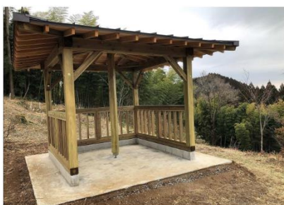
(1)④ 東屋及び展望台の整備 (三股町大平公園)