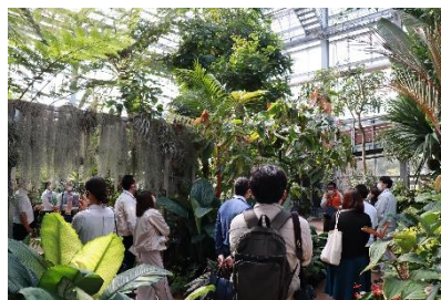
(2)② ガーデンツーリズム制度説明会