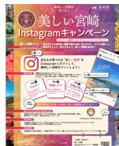
(2)② インスタグラム キャンペーン