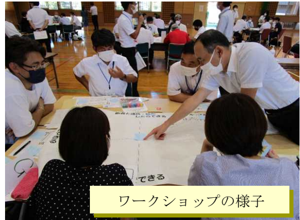
ワークショップの様子

【感想等】中学生による地域振興をテーマにした実践発表や、持続可能な地域を創るためにできることを熟議するワークショップを行いました。参加された方からは、年齢も立場も異なる方との意見交換は非常に有意義であり、新たな価値観をもつことができたという感想等をいただきました。今後も、学校・家庭・地域の連携・協働の充実を図ってまいります。（北部教育事務所）