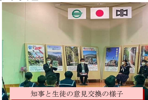
知事と生徒の意見交換の様子

知事が、日之影中学校を訪問して、2年生の生徒25名と『「未来を築く新しい「ゆたかさ」への挑戦』をテーマに授業を行いました。知事からは「ふるさとに誇りを持ち、その素晴らしさを語れるようになってほしい」など生徒へエールが送られました。