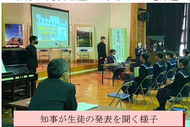
知事が生徒の発表を聞く様子