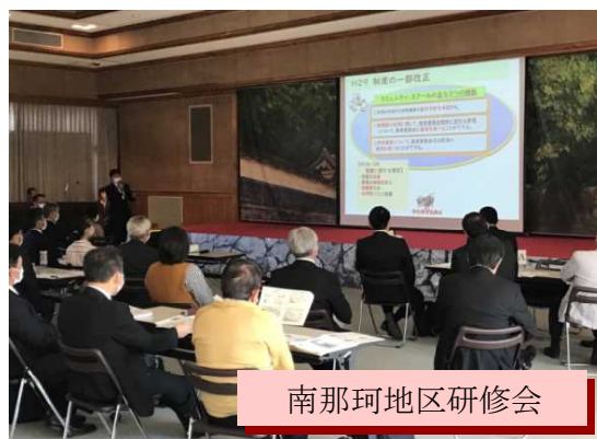
南那珂地区研修会