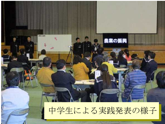
中学生による実践発表の様子

【内容】『コミュニティ・スクール』をテーマとして、宮崎・南那珂・児湯の3地区で開催しましたが、教職員、地域学校協働活動推進員、企業、教育行政、学校運営協議会委員等、幅広い分野の方々に参加してもらい、その必要性や設置・充実の在り方について考えました。それぞれの立場から、コミュニティ・スクールを推進していく必要があるか熱い議論が繰り広げられ、「どの地域、どの学校運営協議会においても必要とされる視点」を明確にいただきました。（中部教育事務所）