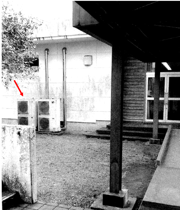
創作工芸館空調機（室外機）