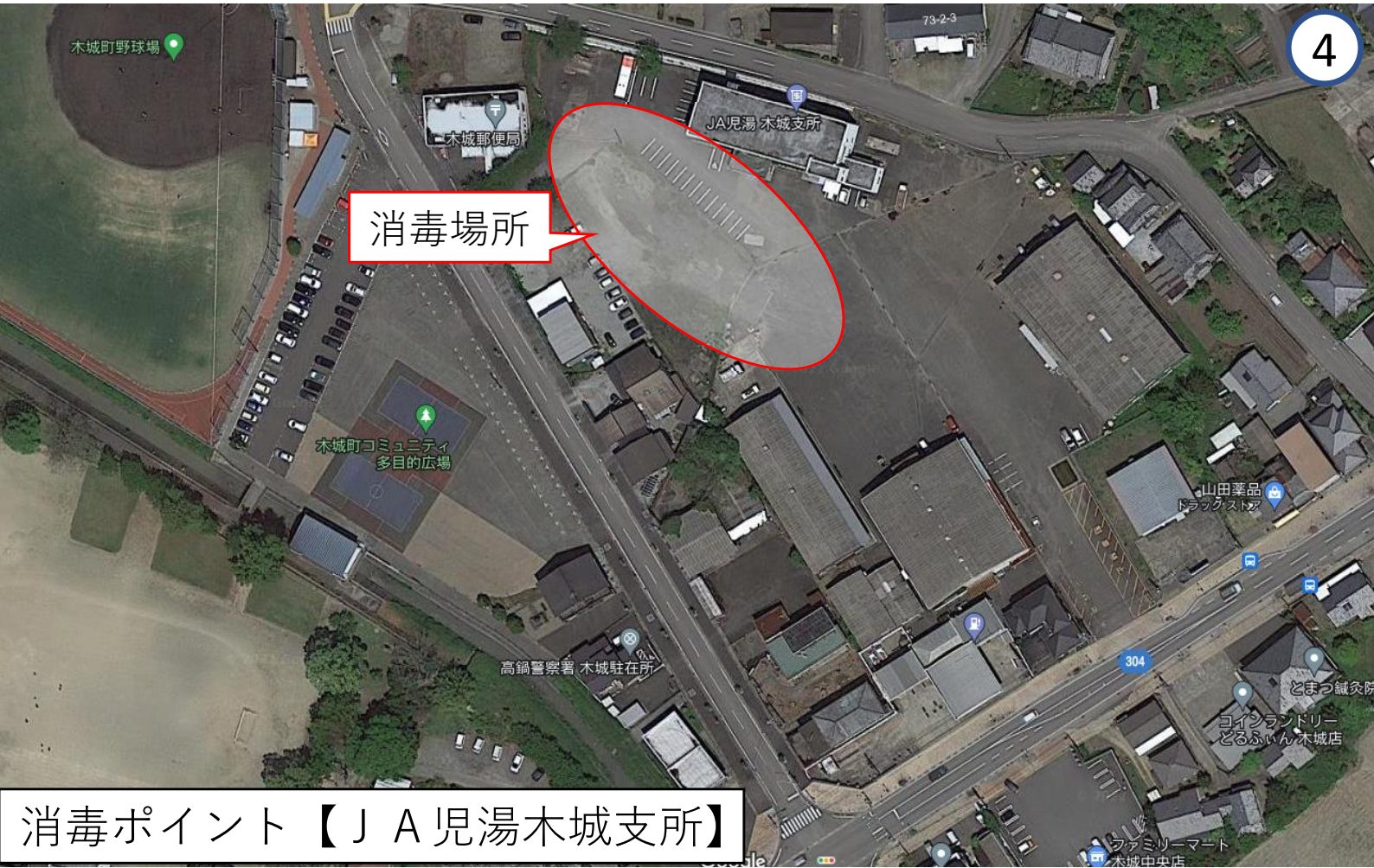
消毒ポイント【J A 児湯木城支所】