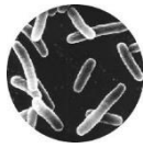
大きさ： 数マイクロメートル

A. レジオネラ属菌は、土の中や池、沼、水たまりなど 自然環境中のどこにもいる細菌 です。増殖に適した温度は 36℃前後 (20～45℃)で、入浴施設などで増殖しやすいことが知られています。